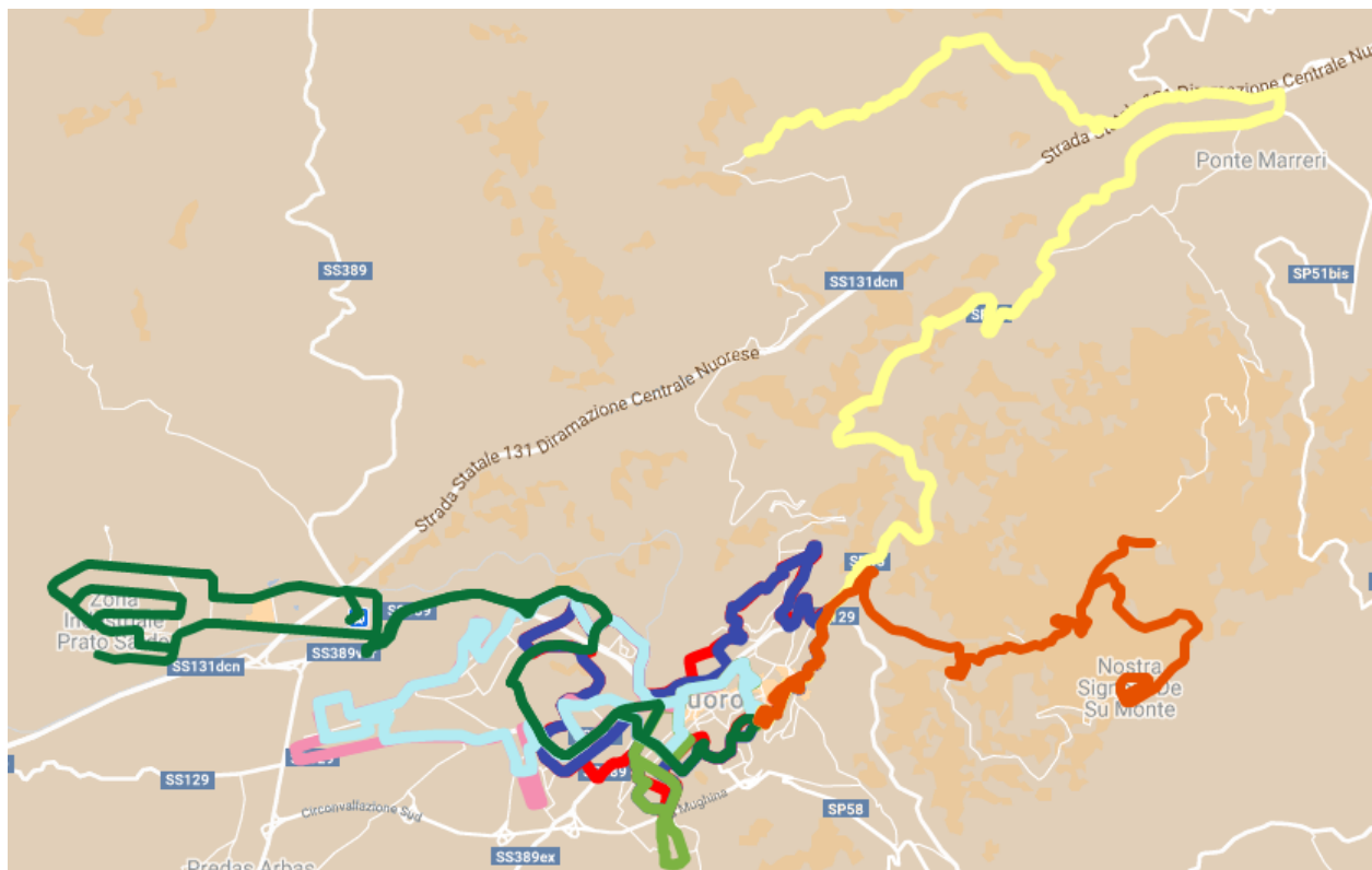
Figura 1 – Mappa delle linee urbane di ATP ed estensione del territorio

i servizi minimi in caso di sciopero le fasce orarie garantite sono indicate negli accordi sindacali